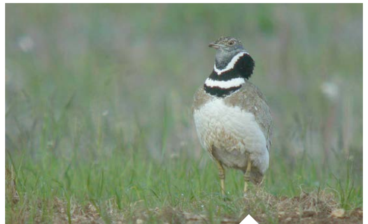
Outarde canepetière

Contactez l'animatrice du site Natura 2000, qui vérifiera l'éligibilité des parcelles et remplira votre dossier.