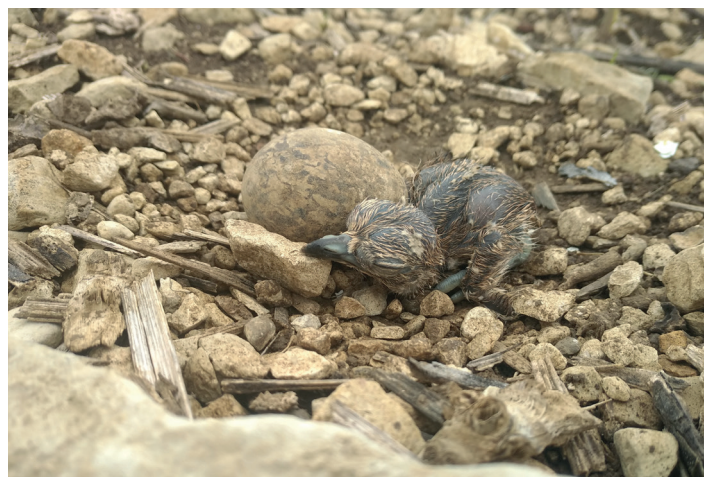
Nid d'œdicnème criard

Grâce à la mobilisation des agriculteurs du site, 10 nids d'œdicnèmes criards ont été protégés en 2020 ! C'est 2 fois plus que l'an dernier, un grand merci à eux !