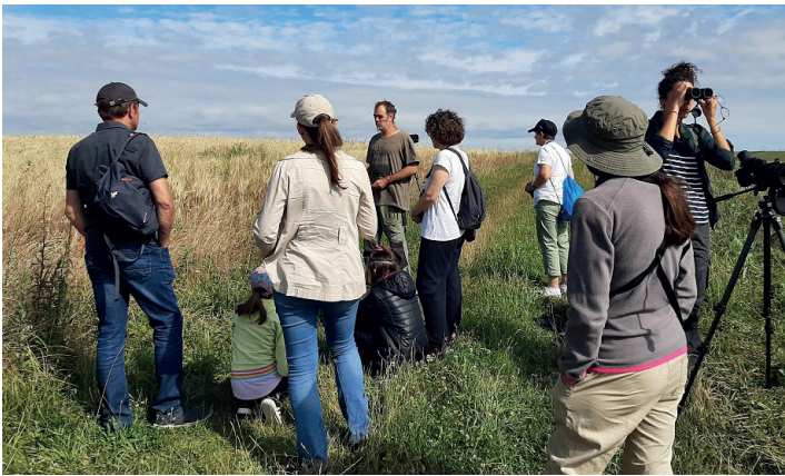
Sortie nature

Le 27 juin 2020 au départ de Gourville, les associations LPO et Charente Nature ont invité le public à découvrir les oiseaux qui nichent dans la Plaine de Barbezières à Gourville. Ce site Natura 2000 abrite notamment l'Outarde canepetière, le Busard Saint-Martin et l'Alouette des champs, trois espèces que le groupe a pu apercevoir ! D'autres oiseaux d'intérêt communautaire comme le Busard cendré, l'Oedicnème criard ou la Pie-grièche écorcheur n'ont pas pu être observés mais ont fait l'objet d'une petite présentation avec photos. En parallèle, nous avons regardé les différentes espèces de plantes aux alentours, dont certaines fleurs messicoles qui poussent préférentiellement dans les cultures, les vignes, les jachères. Ces dernières sont utiles pour la biodiversité et aussi pour les agriculteurs, car elles favorisent la présence d'auxiliaires des cultures (insectes limitant la présence de ravageurs).