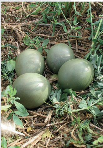
Œufs d'Outarde canepetière

Qui n'aime pas entendre le chant des oiseaux au lever des beaux jours ?